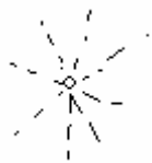
Zonnetje niet op ware grote